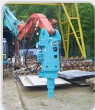
リーダレスで省スペース