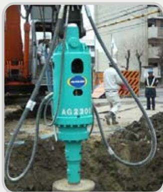
狭小現場での施工に最適